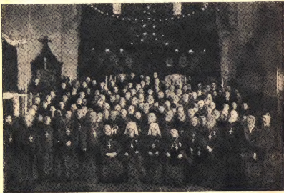
Члены Поместного Собора Русской Православной Церкви от клира и мирян